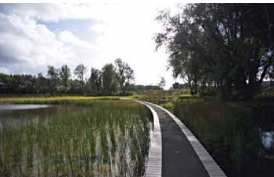
De paden slingeren door het glooiende Bijlmerpark; ze nodigen uit tot steeds weer andere wandelingen.

openbare ruimte is het accent verlegd van kwantiteit naar kwaliteit. Daarnaast is er aandacht voor de bruikbaarheid van openbare ruimtes. Het Bijlmerpark moet zowel het belangrijkste park in het bebouwde gebied worden als een nieuwe woonomgeving vormen met een programma van zo'n zevenhonderd woningen.