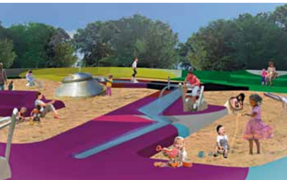
Vrijwel alle wensen die door de kinderen werden geuit konden in het ontwerp van de sport- en spelesplanade worden verwerkt.