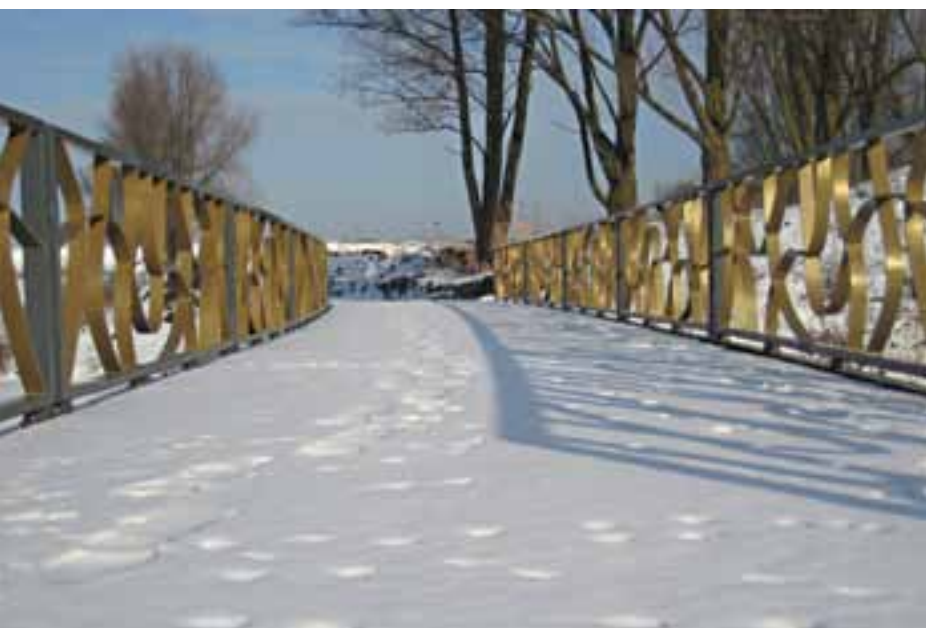
In de bruggen en poorten is de naam Bijlmerpark verwerkt.