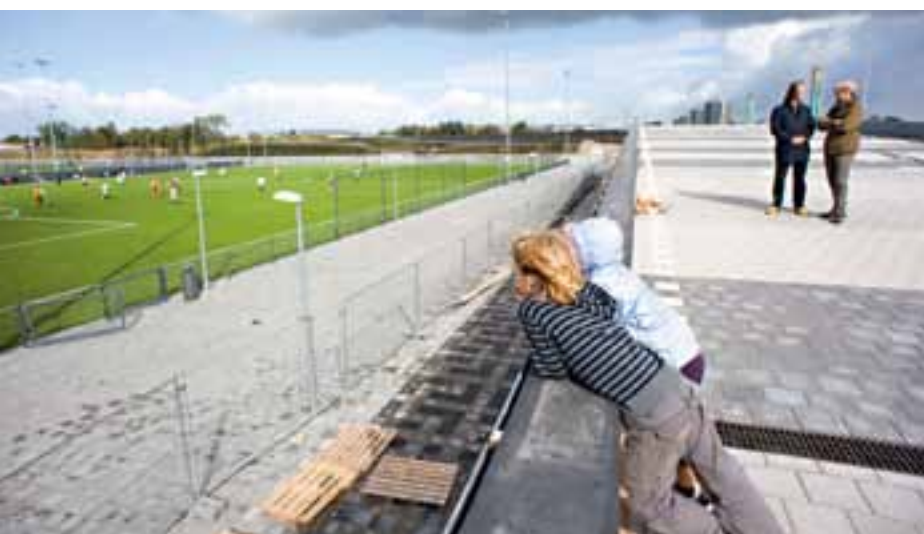
Het deelraadbestuur van Amsterdam Zuidoost koos bewust voor een centrale ligging van het sportpark.

deren van alle leeftijden aangaven dat veiligheid, een schone speeltuin, toezicht en georganiseerde activiteiten onontbeerlijk zijn voor het slagen van deze voorziening. De sport- en spelesplanade is daarom georganiseerd rond een gebouwtje waarin een activiteitenbegeleider speelgoed kan uitlenen, waarin toiletten zijn en dat bergruimte heeft voor bijvoorbeeld de naschoolse opvang. Dit gebouwtje is de basis van een uitkijk- en klimtoren.