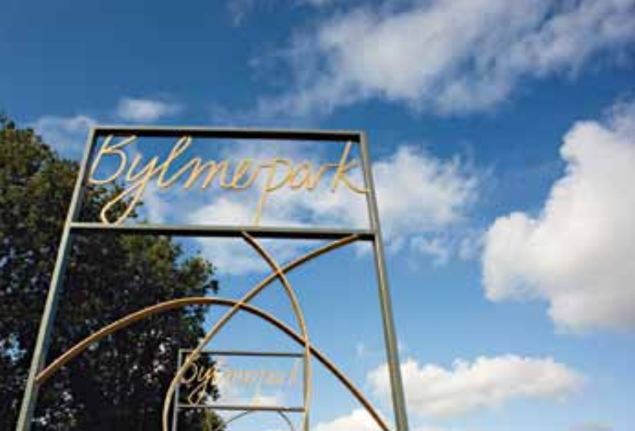
Een herkenbare vormgeving van de entrees zorgen voor een duidelijke identiteit.