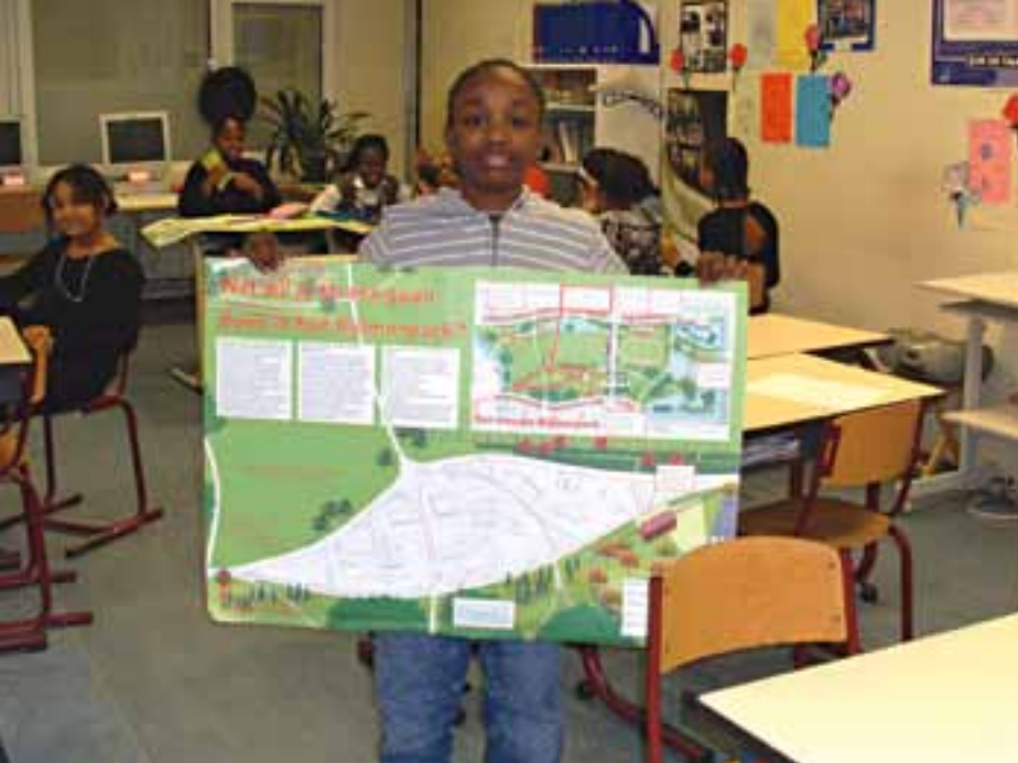
Bij de sport- en spelesplanade was de inbreng van kinderen heel belangrijk; met behulp van posters kon worden aangegeven wat er op dit punt van het park werd verwacht.